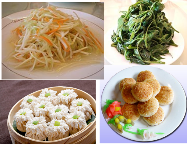
写真 上左: 桔梗炒め 上右: 芋の葉 (中衛御苑福膳) 下左: しゅうまい 下右: 焼き餅 (做膳飯荘) ※写真はイメージです。

○秋の北京はベストシーズン! 3つの世界遺産を含む北京の観光へご案内いたします。ホテルは朝陽南路にある4つ星ホテル『工大建国飯店』に3連泊。