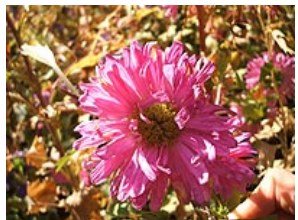
薬膳料理 点心 葉草

【旅行条件書・海外(要約)】お申込の際にお渡しする「旅行申込書/お客様控」に記載の募集型企画旅行条件書も併せて必ずご一読下さい。